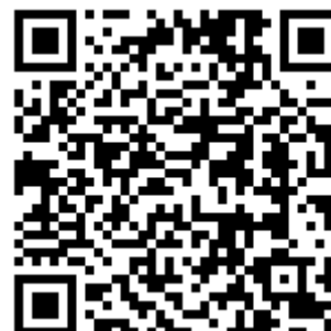
二维码 3-2 配置路由交换机