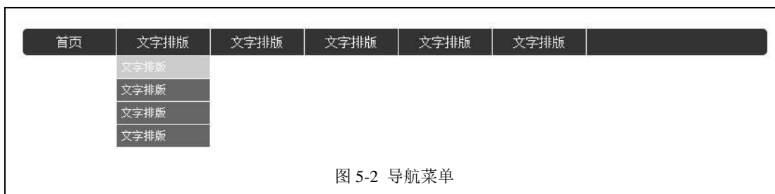
图 5-2 导航菜单