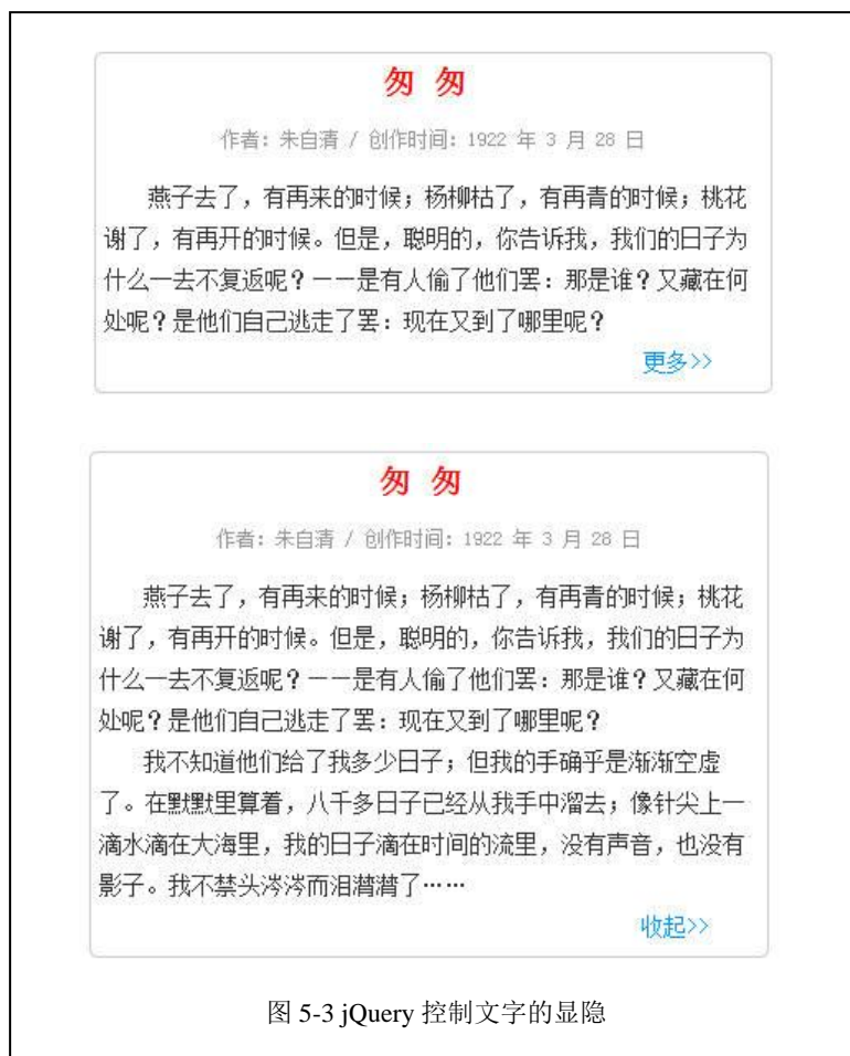
图 5-3 jQuery 控制文字的显隐