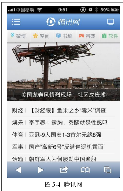
图 5-4 腾讯网