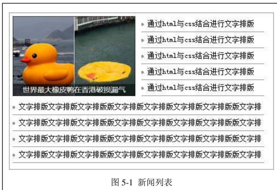
图 5-1 新闻列表