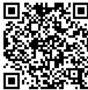
二维码 6-3 实现 DHCP 服务