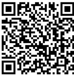
二维码 6-2 创建 DHCP 服务器