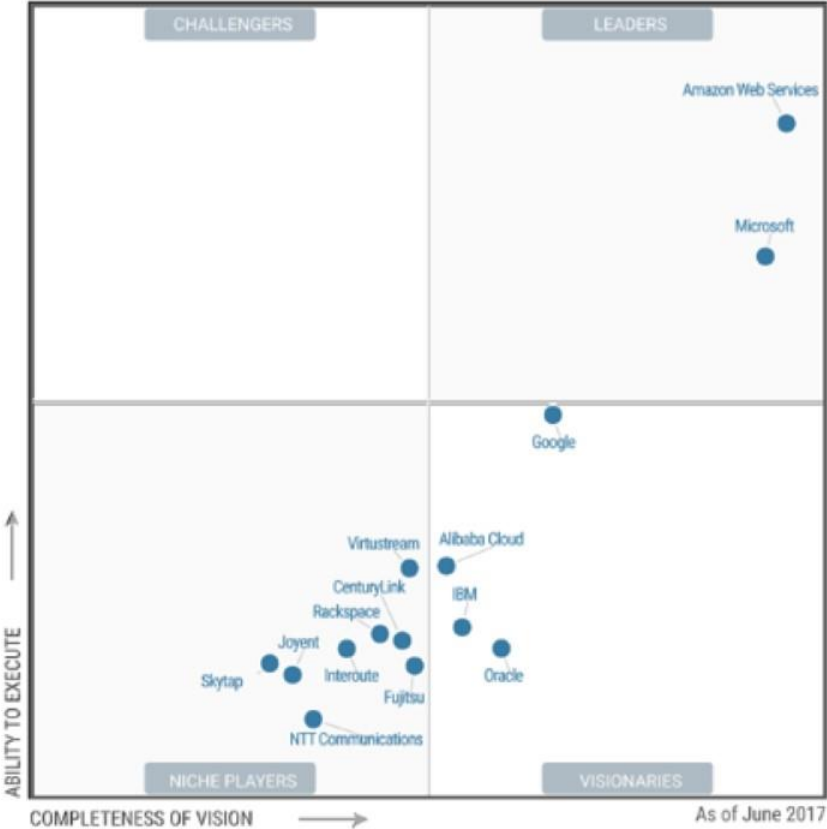
Figure 1. Magic Quadrant for Cloud Infrastructure as a Service, Worldwide