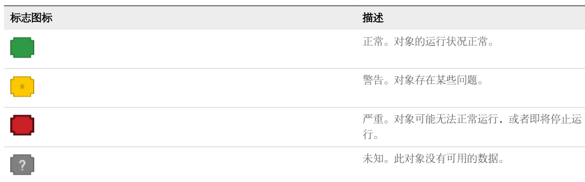
表 7-1. 运行状况